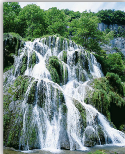
Cascade des Tuffes – Baume les Messieurs

Des attraits importants qui restent dépendants des conditions météorologiques (randonnée, neige, etc.).