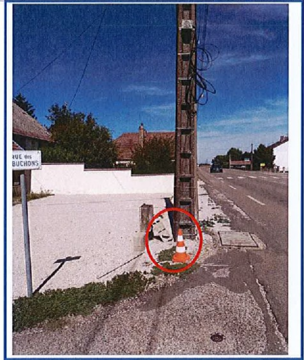
Commentaires du propriétaire