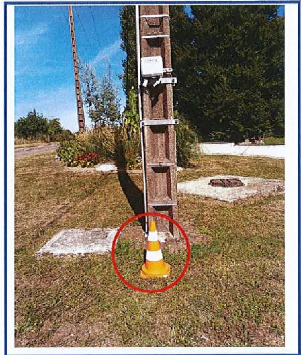
Commentaires du propriétaire

Présenté au propriétaire de la parcelle ou son représentant dûment habilité :