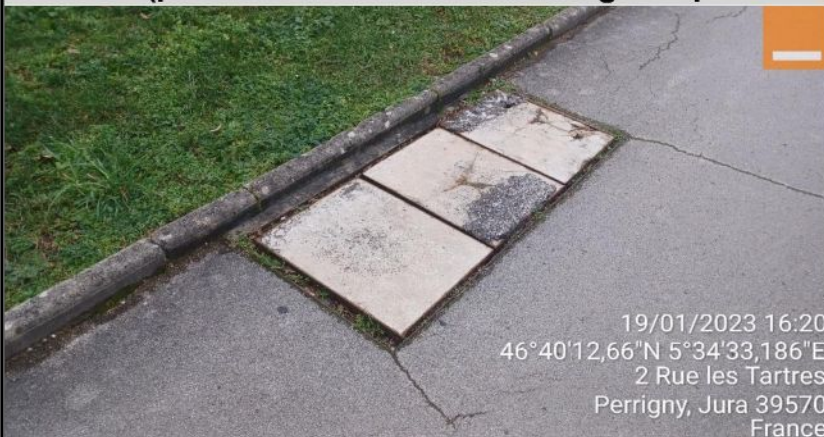
Schéma (plan annoté + situation Google si possible + photos)

Remplacement dispositif de fermeture sur G3C 9-09 par L3T