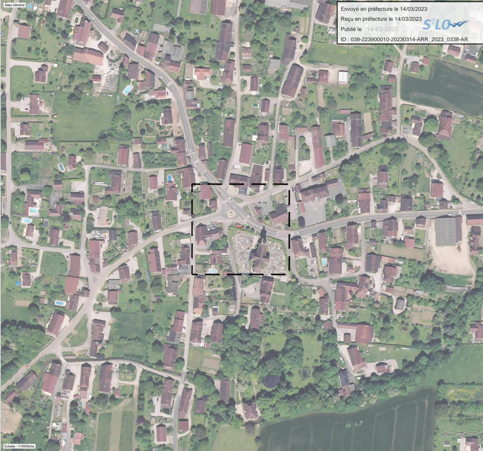
Echelle : 1/1000ème

Envoyé en préfecture le 14/03/2023 Reçu en préfecture le 14/03/2023 Publié le 14-03-2023 ID : 039-223900010-20230314-ARR_2023_0338-AR