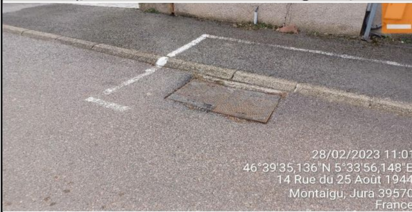
Schéma (plan annoté + situation Google si possible + photos)