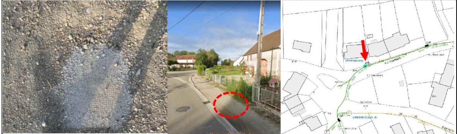
Schéma (plan annoté + situation Google si possible + photos)