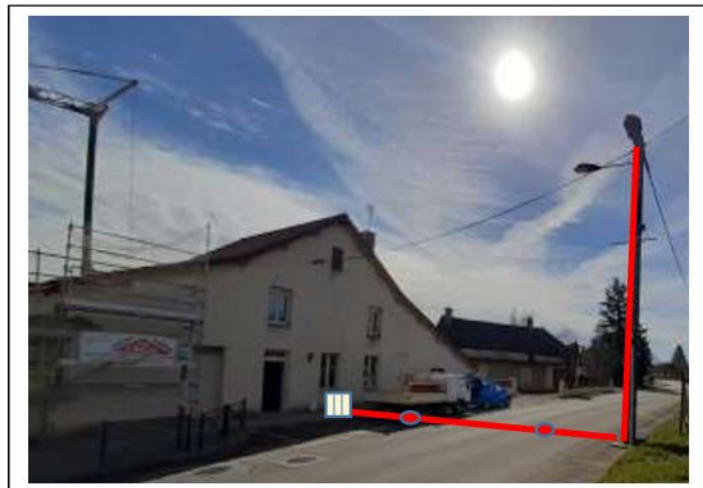
Dépose Branchement aérien + coffrets existant