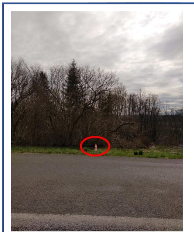
Commentaires du propriétaire