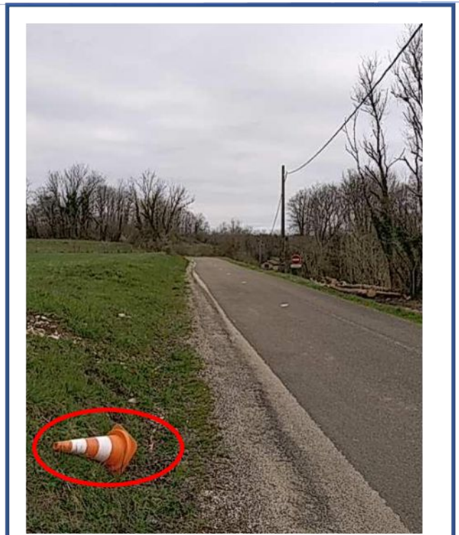
Commentaires du propriétaire