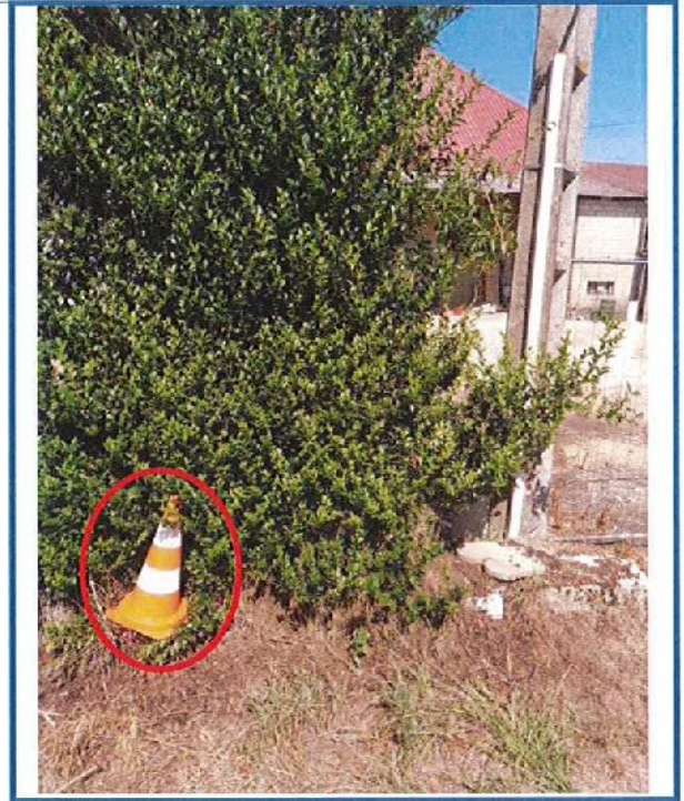
Commentaires du propriétaire