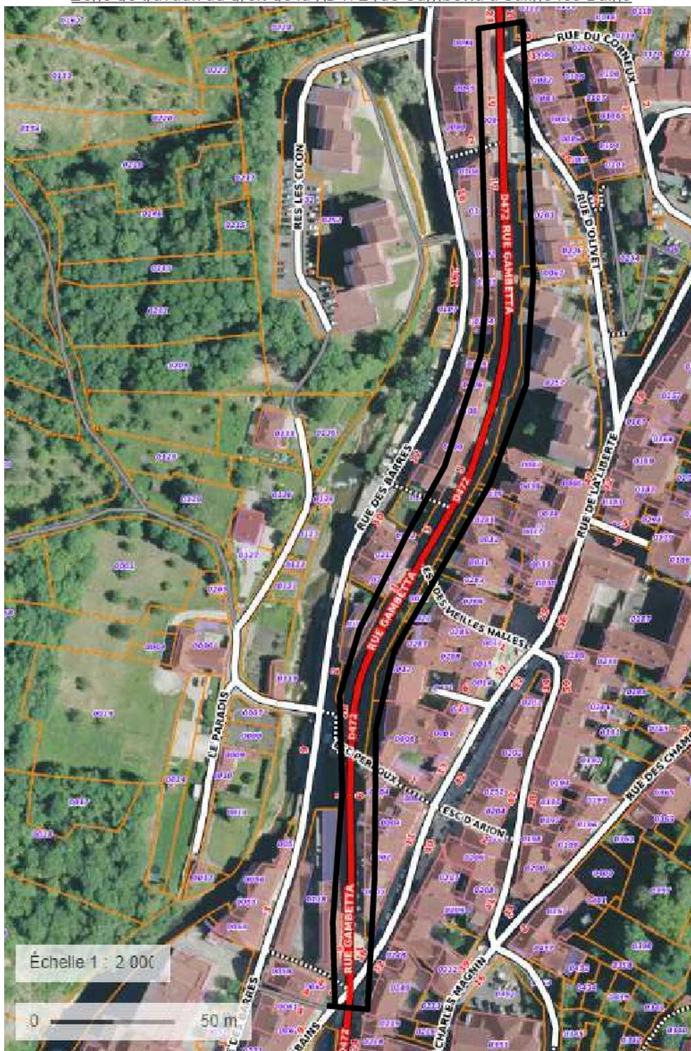
Zone de travaux au droit de la RD472 rue Gambetta à Salins-les-Bains

ID : 039-223900010-20230710-ARR_2023_0934-AR