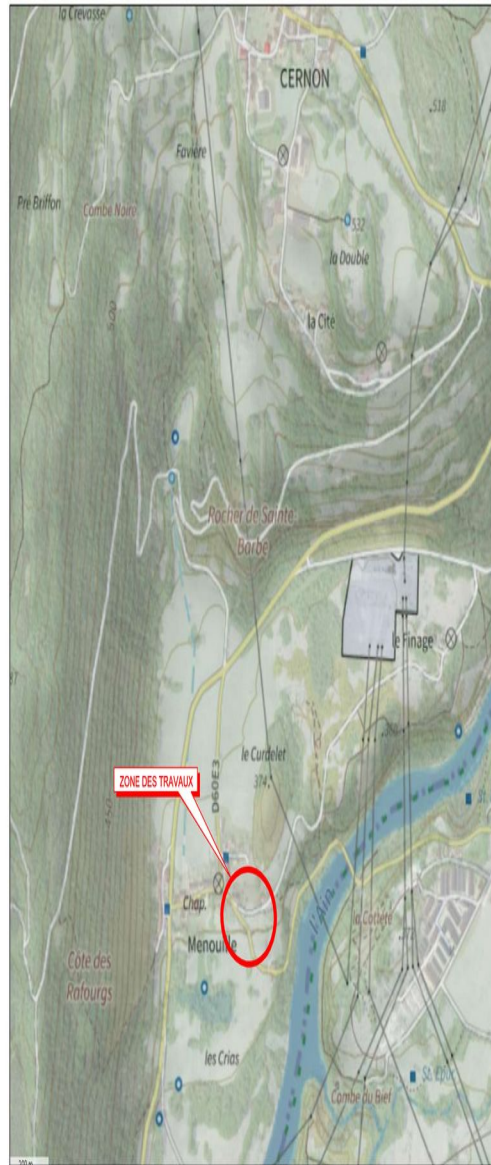
Plan de Situation - Ech: 1/10 000