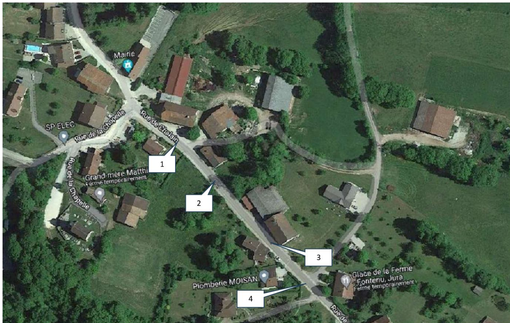
Fouille de réparation de réseaux télécom à Fontenu