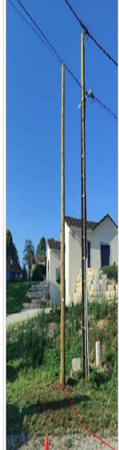
L'implantation des réseaux de concessionnaires, n'est reportée sur les plans qu'à titre purement indicatif et donc transmise sous toutes réserves.