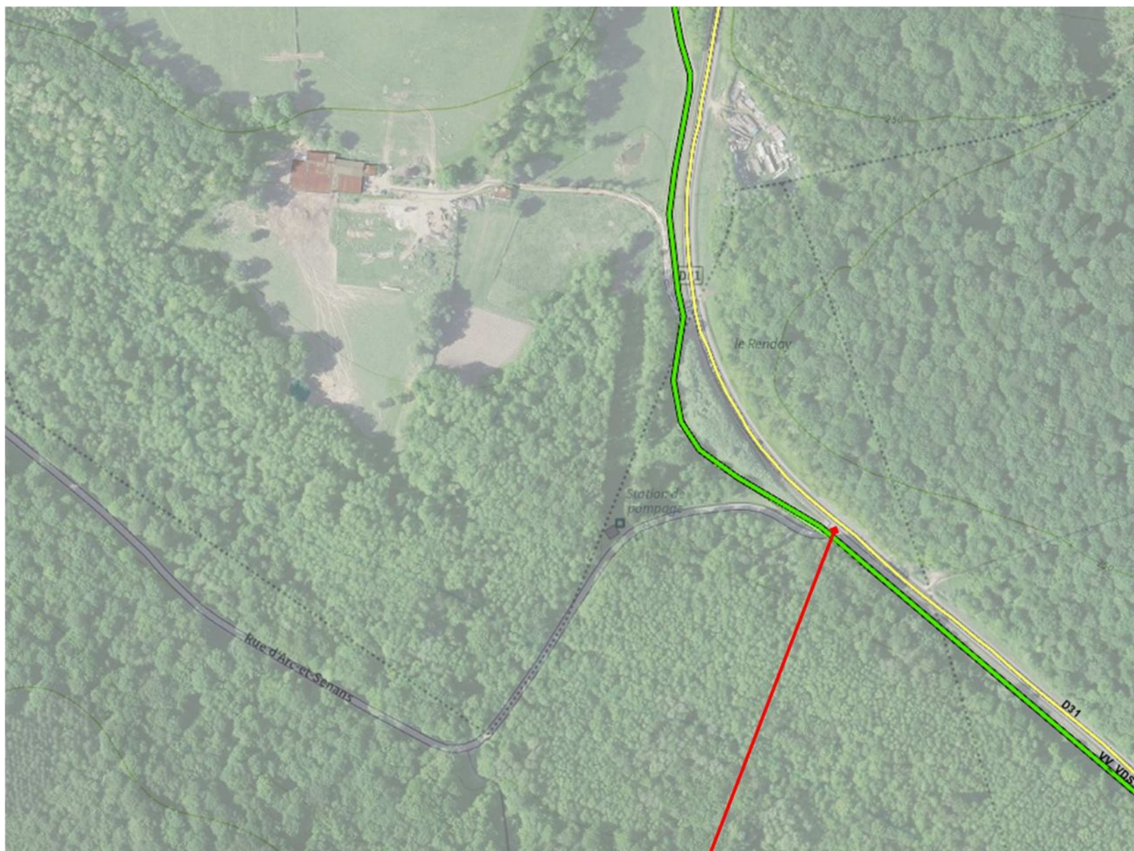
Commune de Plumont