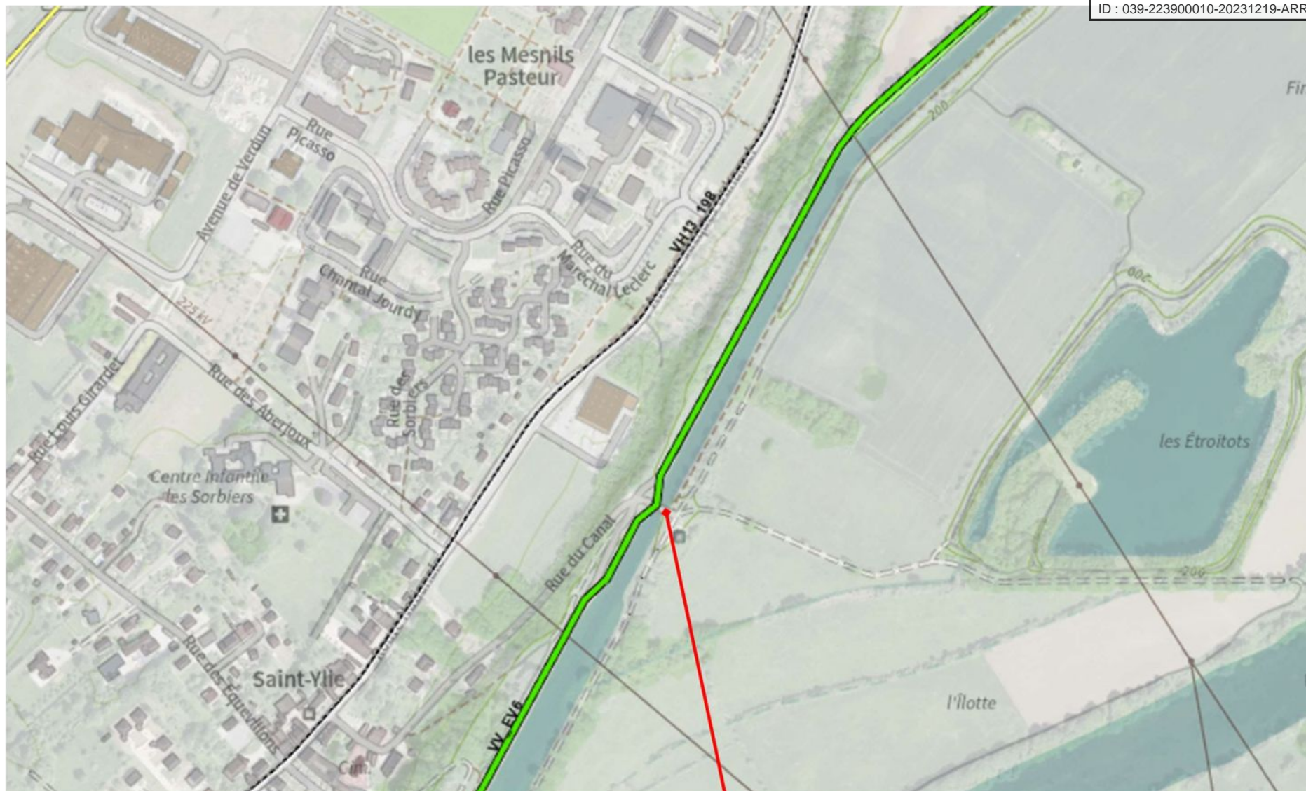
Commune de DOLE