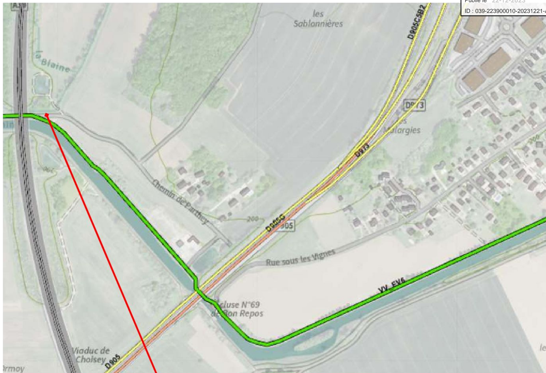
Commune de Choisey