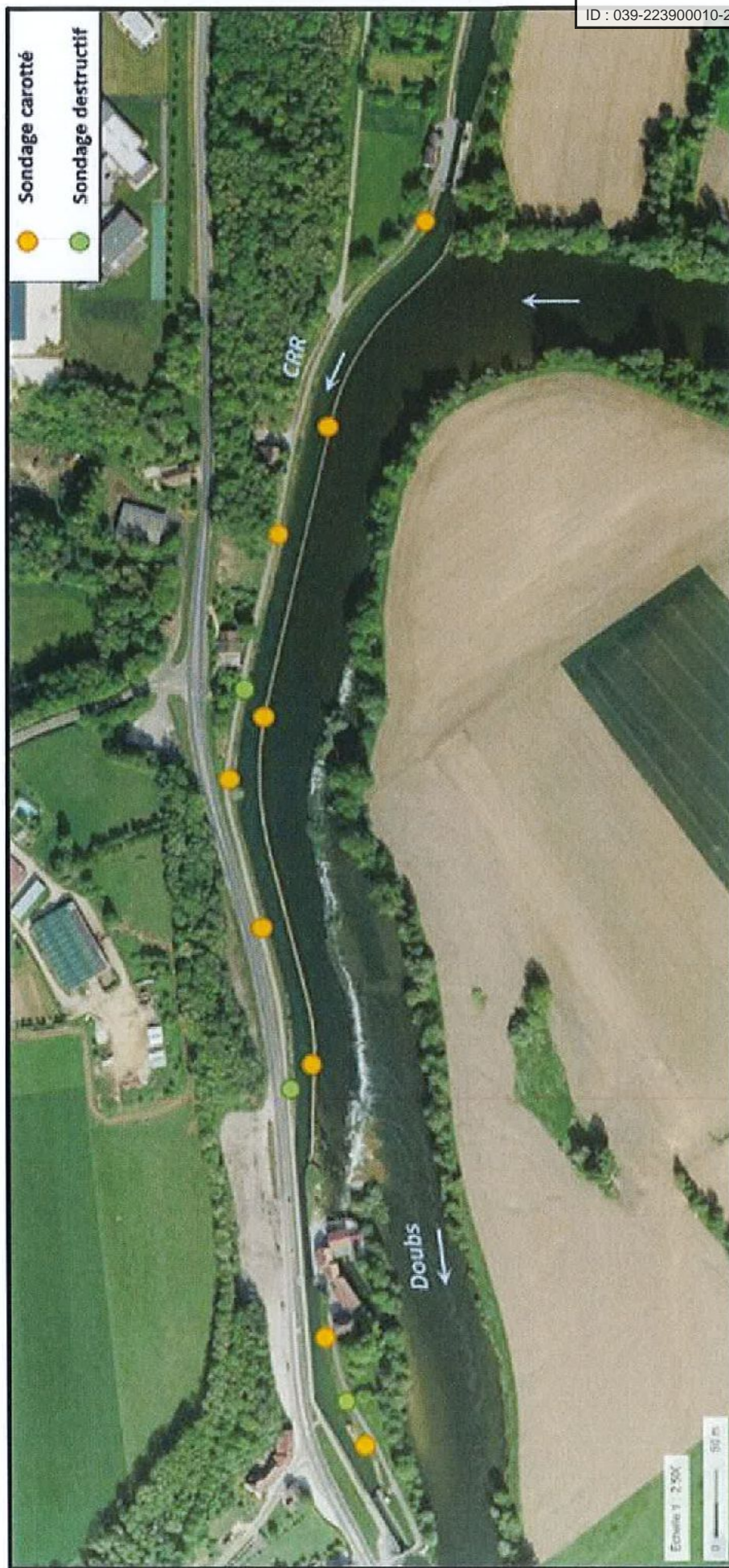
Figure 3. Localisation des sondages géotechniques

La localisation des sondages géotechniques est précisée sur la carte suivante :